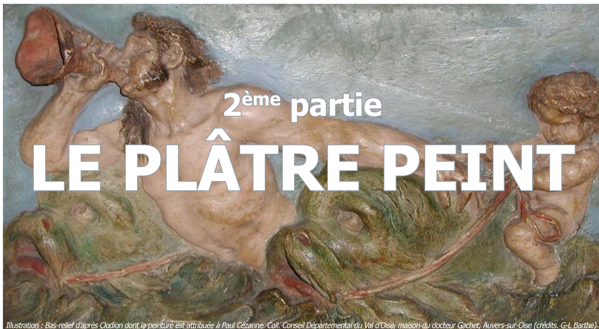
Illustration : Bas-relief d'après Clodion dont la peinture est attribuée à Paul Cézanne. Coll. Conseil Départemental du Val d'Oise, maison du docteur Gachet, Auvers-sur-Oise

Médiathèque de l'Architecture et du Patrimoine - Auditorium -