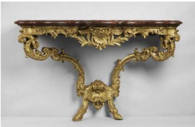
Console du château de Bercy

Une étude mécanique sur ce meuble a été entreprise à l'Institut d'Ingénierie et de Mécanique de Bordeaux. En se basant sur la modélisation 3D et des lois de comportement pertinentes, divers modes de ruine potentielle du meuble liés à sa conception et sa fabrication. Dans un deuxième temps, une analyse des scénarios de restauration est proposée à partir du modèle mécanique. L'objectif est de permettre au restaurateur de disposer d'informations sur la sensibilité des paramètres de restauration (diamètre, angle, nature, position, longueur des renforcements) et des scénarios de restauration envisagés.