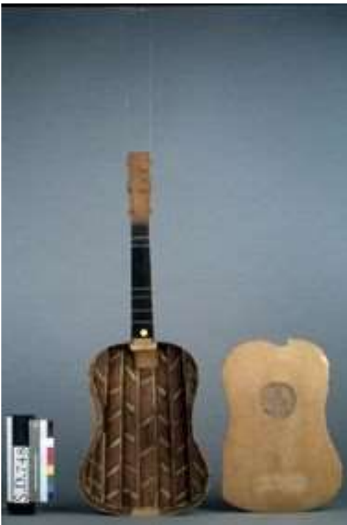
Vihuela 16 ième Siècle

C'est les aspects les plus saillants de ces épisodes que nous nous proposons d'aborder pour la journée d'étude du groupe « Bois ».