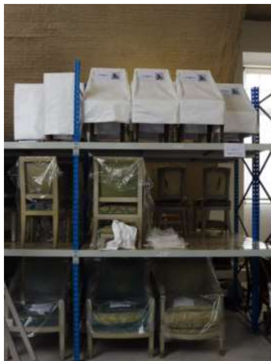
Installation des collections au château de Fontainebleau

Du cahier des charges au conditionnement sous housse, le chantier des collections mis en œuvre au château de Fontainebleau est consacré au traitement de conservation de 700 sièges auparavant stockés sous les toits depuis les années 1960. Ce lot représente environ un tiers des sièges en réserve du château. Réalisé par une équipe pluridisciplinaire de spécialistes, le chantier est organisé sur place, dans un atelier créé en 2013. Il s'agit d'établir une chaîne de traitement efficace : après le déménagement des sièges par convois successifs pour un traitement extérieur contre les insectes, chaque objet fait l'objet d'un constat, puis est dépoussiéré voire dégrassé, parfois consolidé afin de stabiliser tous les matériaux constitutifs de ces sièges pour en assurer la préservation. Objet composite par excellence, le siège nécessite un traitement des bois cirés, vernis, peints ou dorés qui est réalisé avec le respect des garnitures anciennes, des différents textiles présents et de la passementerie, mais aussi du cuir ou du cannage.