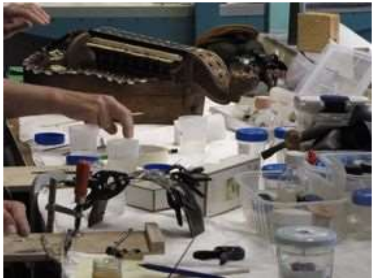
Nettoyage d'une vielle à roue