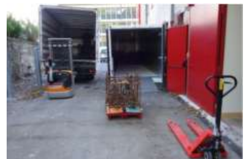
Musée de Besançon - Chantier de collection, traitement par congélation par le CRRCOA