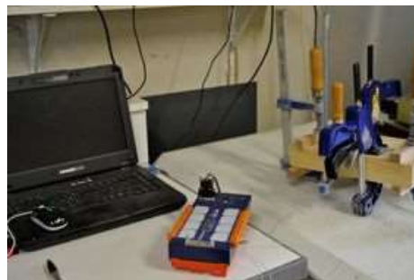
Système de mesure pour évaluer la cinétique du froid dans le bois