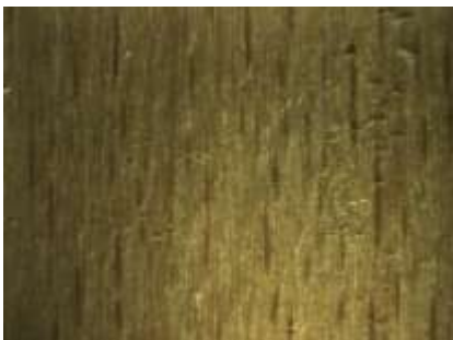
Mélange 10% carnauba / 90% abeille sur du bois après congélation dans l'azote liquide

A la suite de la présentation de ces résultats, la mise en œuvre de la méthode dans le cadre du chantier de la collection du Musée des Beaux-Arts de Besançon sera effectuée. Ce grand chantier montre la pertinence de cette solution de désinsectisation. Il montre aussi, la nécessité de l'application et du professionnalisme qui doivent entourer ce type de traitement.